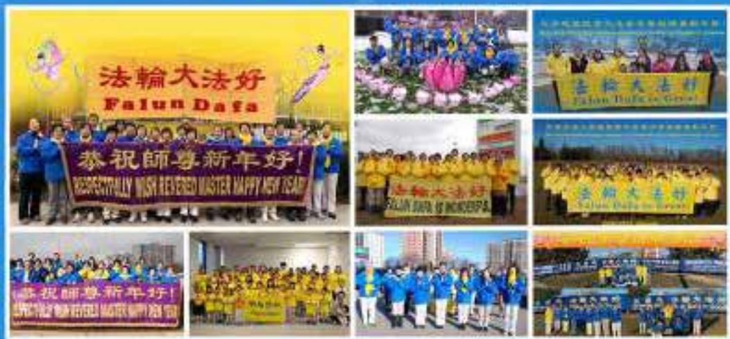
加拿大多倫多全體大法弟子敬賀 二零二一年