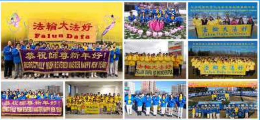
加拿大多倫多全體大法弟子敬賀 二零二一年