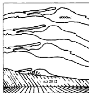
圖2. 公元前6000年至2012年之間, 銀河系和冬至的太陽重合的過程。

根據瑪雅曆法, 1992 年是最後一個 Baktun (第十三個) 的最後一個 20 年的第一年 (20 年就是一個 Unial, 瑪雅曆法稱這最後的 20 年為“地球更新期”)。縱觀近十年的大事 (1992 - 2001) 唯有李洪志先生所倡導的以宇宙精神“真善忍”為修煉原則的法輪大法能被認為正在起著淨化地球的作用。我後來又發現了兩個有意思的數字, 1992 年正是李洪志先生在社會上公開傳法輪大法的第一年。從 1992 年到 1999 年短短 7 年時間裏, 中國的修煉者已達近億之眾。李洪志先生使得眾多的修煉者從拜金縱慾的社會死圈中走出來, 教修煉