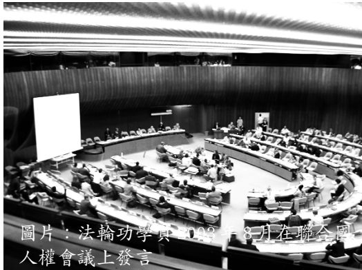
圖片：法輪功學員2003年8月在聯合國人權會議上發言

国际信仰组织的乔尔勒·珀拉契昂(JOELLE PERRACHON)指出，在中国，对所有修炼法轮功的妇女所施行