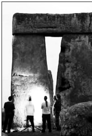
圖：激光掃描發現巨石上有雕刻物

這些每年有上百萬人參觀的著名的石頭，建造於5千年前。石柱平均重量達26噸，最高的高達10米，