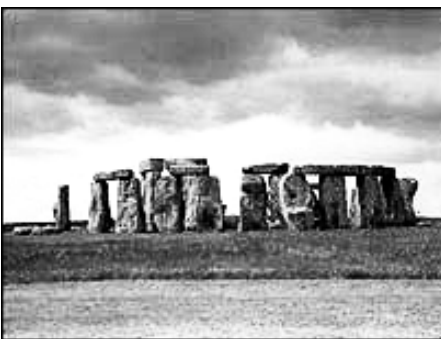
圖：5000多年歷史的英格蘭巨石陣

據BBC 10月16日報導，利用高技術激光掃描已有5000多年歷史的英格蘭島南部Wilshire省的巨石陣(Stonehenge)，發現了兩個原來用肉眼看不到的雕刻物。