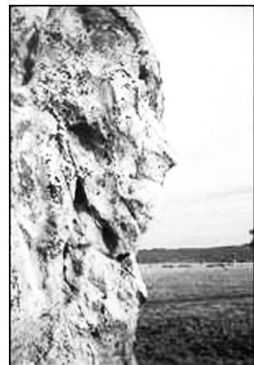
圖：巨石側面雕刻著4000年前的人的臉

平均高度在4公尺以上，排成圓形，相鄰的2—4個直立石柱之上橫一個石塊。到底巨石陣有甚麼用途？是廟？天氣預