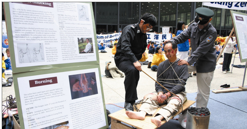
烙鐵烙酷刑：警員將一根鐵條在電爐上燒紅後，壓在法輪功學員的雙腿上烙燙，受刑者雙腿發抖、痛苦不堪以致於小便失禁。

注射神經破壞性藥物、壓刑、電刑、火刑、吊打、老虎凳、死人床、竹籤、灌食、銬刑、關鐵籠子等。