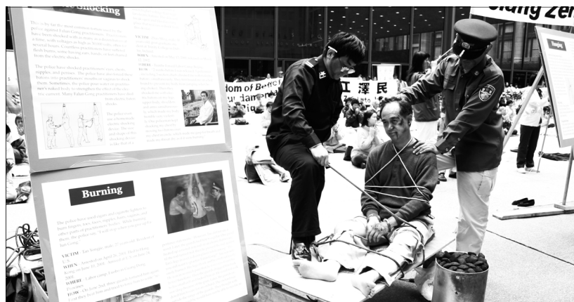
烙鐵烙酷刑：警員將一根鐵條在電爐上燒紅後，壓在法輪功學員的雙腿上烙燙，受刑者雙腿發抖、痛苦不堪以致于小便失禁。

注射神經破壞性藥物、壓刑、電刑、火刑、吊打、老虎凳、死人床、竹籤、灌食、銬刑、關鐵籠子等。