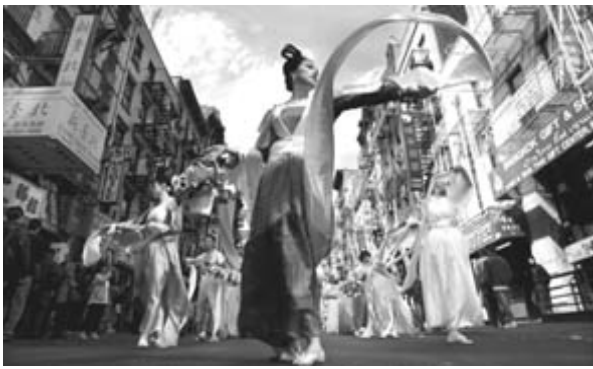
图片：法轮功游行入选时代网络一周最佳图片

4月10日法轮功学员在纽约中国城游行中表演舞蹈。有数千法轮功学员参加了这次游行，他们希望展示法轮功的和平美好，并呼吁中国停止迫害法轮功。