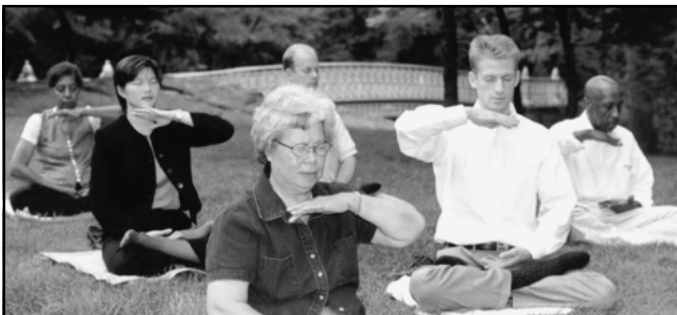
Harjoittajat kaikkialla maailmassa, jotka ovat etsineet totuutta ihmisestä ja elämän tarkoituksesta, ovat löytäneet Falun Dafasta vastauksen elinikäiseen etsimiseensä.

Monimutkaiset olosuhteet jokapäiväisessä elämässä ja yhteiskunnassa antavat harjoittajalle parhaimmat mahdollisuudet kohottaa sydämen luonnettaan ja moraaliaan (Xinxing).