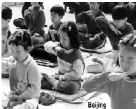
Все от мала до велика могут заниматься Фалунь дафа

В один из самых трудных дней, 22 июля 1999 г, основатель Фалунь Дафа г. Ли Хун Чжи в своем письме «Мое заявление» открыто заявил: «Китайский Фалуньгун является лишь практикой массового характера, не имеет никакой организации и не преследует никаких политических целей. Никогда не участвовал ни в каком антиправительственном движении. Я, человек самосовершенствующийся, никогда не имел никакого отношения к политической власти, я лишь обучаю людей самосовершенствоваться. Если человек хочет хорошо заниматься практикой, то он должен стать человеком высокой морали». В одном из своих писем еще в сентябре 1996 года Ли Хун Чжи отмечал: «Практикующие должны как следует выполнять свою работу,