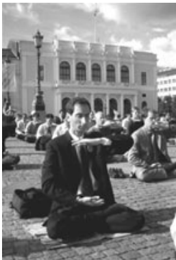
Gustaf Adolf'in tori, Göteborg

Falun Gong , tunnettu myös Falun Dafana, on ikivanha henkinen menetelmä joka edistää terveyttä ja auttaa harjoittajaa ymmärtämään elämää syvällisemmältä tasolta. Että niin monet ihmiset ovat ottaneet Falun Gongin sydämeensä, riippuu siitä, että menetelmä on todella tehokas mitä tulee terveyden palauttamiseen ja ruumiin, sielun ja mielen sopusoinnuttamiseen. Toukokuusta 1992 lähtien, jolloin se tuotiin julkisuuteen Kiinassa, se on auttanut yli 100 miljoonaa harjoittajaa yli 40 maassa.