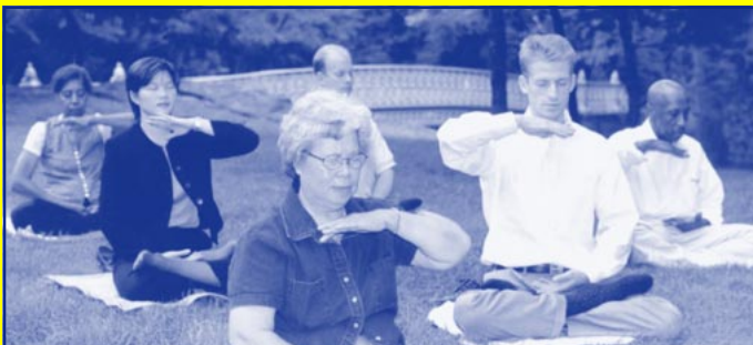
Utövare från hela världen har i Falun Dafa funnit svar i sina livslånga sökanden efter sanningen om människan och meningen med livet.

De komplicerade omständigheterna i vardagslivet och i samhället bidrar med de bästa möjligheterna för en utövare att kunna höja sitt hjärtas natur och sin moral (Xinxing).